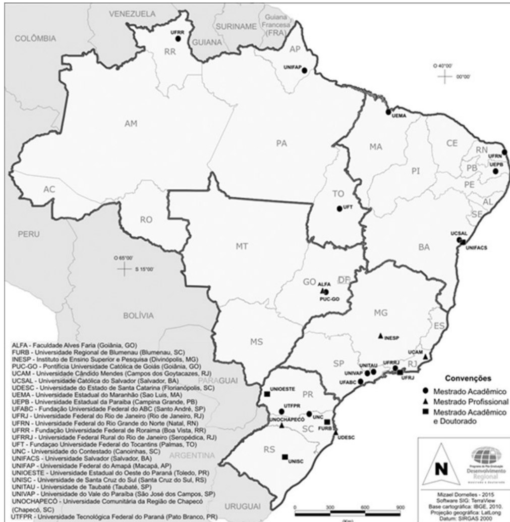
Figura 1: Localização dos Programas Analisados - 2012